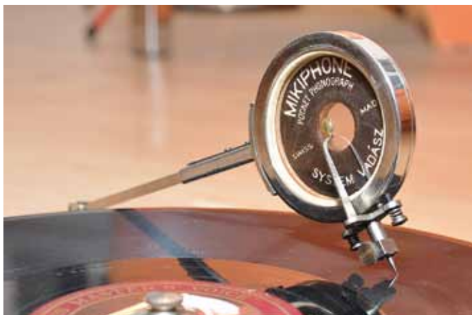
Mechanische Tonaufzeichnung beim Grammophon

Das heisst nun aber nicht, dass die mechanischen Verfahren unbedingt realistischere Resultate liefern würden. Der Frequenzgang ist – bedingt durch den grosse Spitzenradius, die mechanische Umsetzung und die akustische Verstärkung – schon sehr