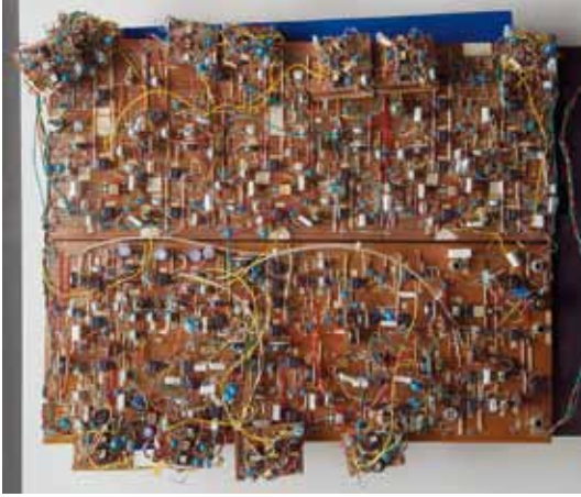
Prototyp des Dolby-SR Rauschunterdrückungssystems

Eine effektive Rauschunterdrückung erreicht man durch die Kombination der beiden Verfahren. Dabei wird das Eingangssignal abhängig von Pegel und Frequenz im hörbaren Bereich unterschiedlich stark angehoben. Dieses Verfahren ist durch die Entwicklungen von Dolby Laboratories in der Tonband- und Kassettenteknik weit verbreitet: Dolby B, C und S; im professionellen Bereich auch Dolby A und SR.